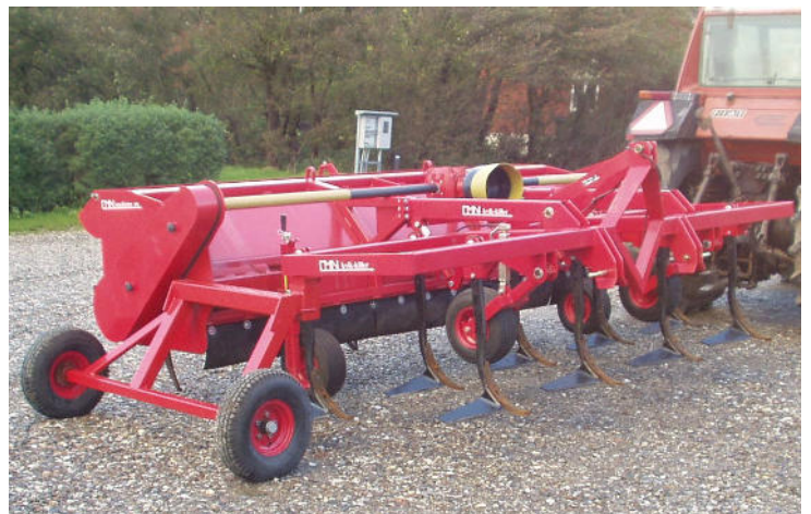
KK400 med sikringsbolt på stubtand og bugsering

Stubharven kan fås med 2 forskellige former for stenudløser, enten som en mekanisk udløsning i form af springbolt eller med mekanisk fjederudløsning. Desuden er alle kvik-killere forsynet med PTO automatkobling