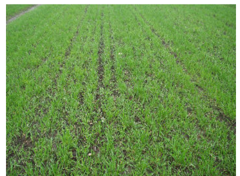
Korn der er sået med kvik-killer

Centerrækkeafstanden på rækkerne er ca. 200 mm, og på grund af den specialudviklede sådyse bliver rækkebredden ca. 100 mm. Det sikrer, at de enkelte planter har god mulighed for at buske sig.