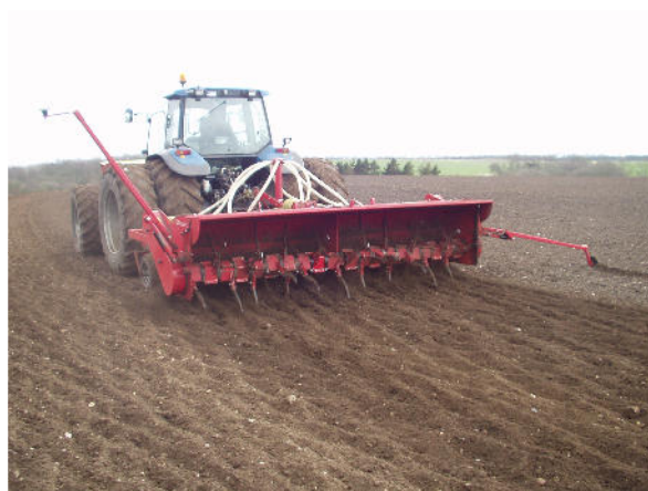
CMN Kvik-killer med såmaskine set bagfra

Maskinerne er alle trepunktsophængte, og kræver et stk. enkeltvirkende hydraulikudtag. Rotoren kræver et kraftudtag på 540 PTO omdr. Totallængde på maskinerne med springboltsikring for harve-tænderne er 2900 mm. Med fjedersikring er længden 3550 mm. Kraftbehovet er ca. 35 HK/25 KW pr. meter. Til maskiner over 3 m kan der fås bugservogn.