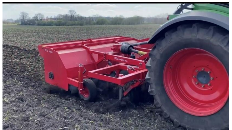
KK300G 3 m liftofhængt kvik killer

Stubharven kan fås med 2 forskellige former for stenudløser, enten som en mekanisk udløsning i form af springbolt eller med mekanisk fjederudløsning. Desuden er alle kvik-killere forsynet med PTO automatkobling