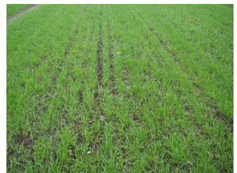
Korn der er sået med kvik-killer

Centerrækkeafstanden på rækkerne er ca. 200 mm, og på grund af den specialudviklede sådyse bliver rækkebredden ca. 100 mm. Det sikrer, at de enkelte planter har god mulighed for at buske sig.