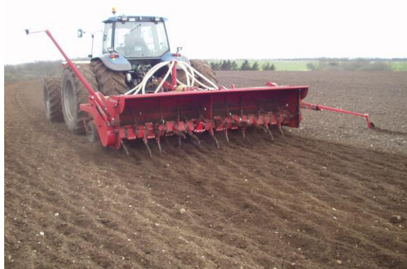
CMN Kvik-killer med såmaskine set bagfra

Maskinerne er alle trepunktsophængte, og kræver et stk. enkeltvirkende hydraulikudtag. Rotoren kræver et kraftudtag på 540 PTO omdr. Totallængde på maskinerne med springboltsikring for harve-tænderne er 2900 mm. Med fjedersikring er længden 3550 mm. Kraftbehovet er ca. 35 HK/25 KW pr. meter. Til maskiner over 3 m kan der fås bugsérvogn.