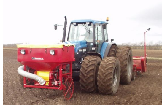
Frontmonteret såtank på CMN Kvik-killer 4 m

Ved at udbygge CMN kvik-killer med pneumatisk såmaskine kan du med fordel etablere den kommende kulturafrøde med kvik-killeren på pløjet jord eller direkte i stub.