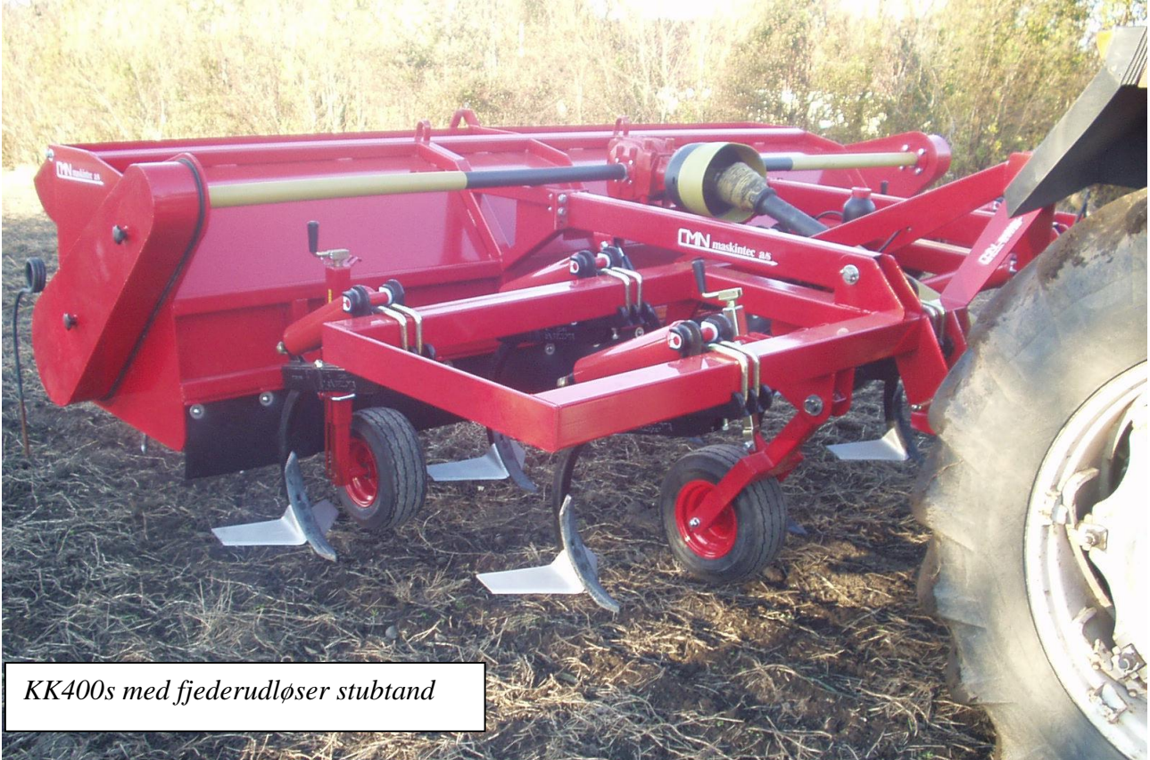
KK400s med fjederudløser stubtand

CMN kvik-killer, din optimale løsning for frilæggelse af rodukruddt såsom kvik, skræpper, tidsler samt andet rodukruddt i stub eller på pløjet jord.